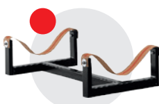
Supporto per tende